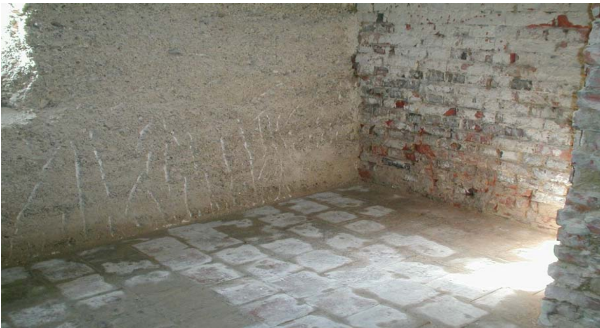
Abbildung: Feuchteschaden im Keller, sowohl bei Ziegel als auch bei Beton

Seit der Instandsetzung ist der gesamte Kellerbereich als hochwertiger Bürobereich und zum Teil als Wohnung genutzt.